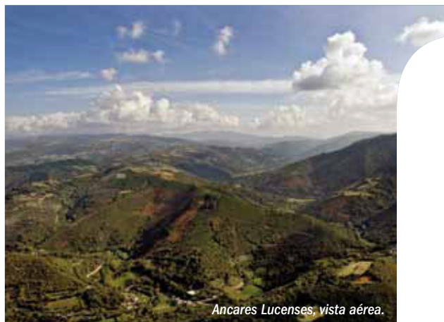
Ancares Lucenses, vista aérea.

Fecha de declaración: 27 de octubre de 2006 Superficie: Extensión oficial: 53.664 ha (núcleo: 26,5%; tampón: 59,6%; transición: 13,9%) Ubicación: Provincia de Lugo (Comunidad Autónoma de Galicia) Municipios: Navia, Cervantes y Becerreá Entidad gestora: INLUDES-Diputación Provincial de Lugo Dirección: Ronda da Muralla 140, 27004 LUGO Teléfono: 982227812 Correo electrónico: laura.vazquez@deputacionlugo.org Web: www.deputacionlugo.org Otras figuras de protección: Zona de Especial Protección de los Valores Naturales (ZEPVN): (2) Lugar de Importancia Comunitaria (LIC) Zona de Especial Protección para las Aves (ZEPA) Zona de Especial Protección para el Oso pardo Reserva Nacional de Caza Región Biogeográfica: Eurosiberiana/Mediterránea