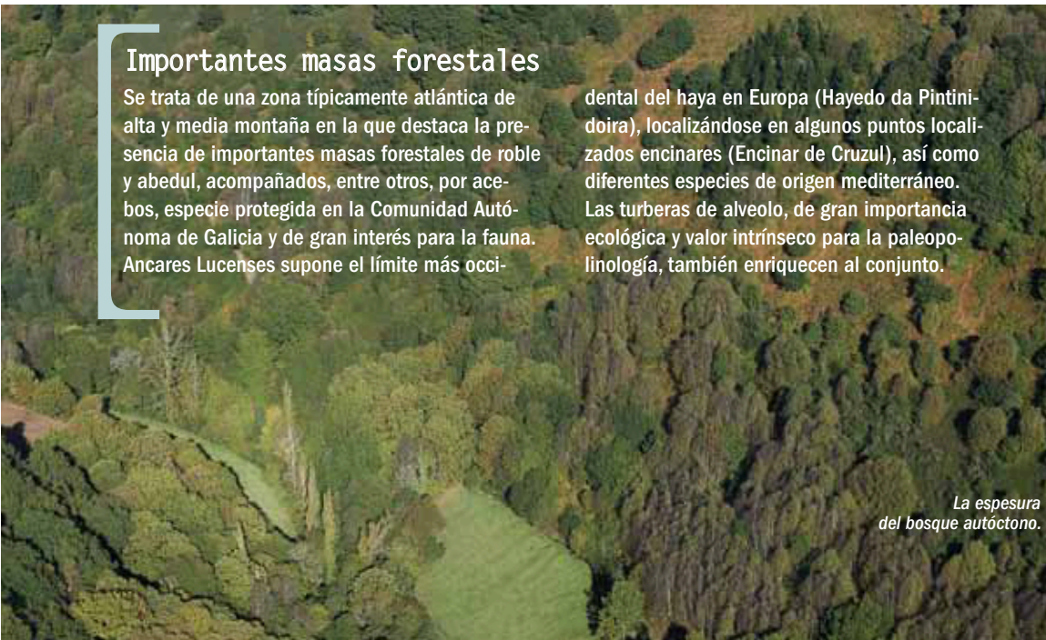
La espesura del bosque autóctono.

dental del haya en Europa (Hayedo da Pintinoeira), localizándose en algunos puntos localizados encinares (Encinar de Cruzul), así como diferentes especies de origen mediterráneo. Las turberas de alveolo, de gran importancia ecológica y valor intrínseco para la paleo-polinología, también enriquecen al conjunto.