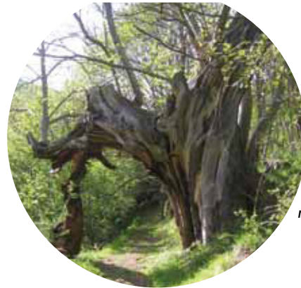
Castaño centenario, monumento natural.

Se encuentran medios agropastorales de gran interés ecológico, puesto que