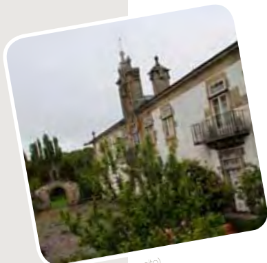
Pazo de Sistollo (Cospeito)

No podemos concluir nuestra travesía sin antes visitar alguno de los establecimientos especializados en la elaboración del afamado queso de San Simón, tan peculiar por su forma como por su exquisito sabor, o cualquiera de los otros productos que nos ofrece la ancestral maestría culinaria de la zona.